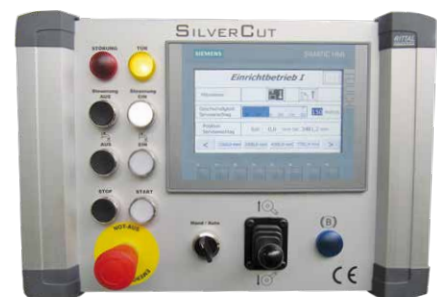
Bedienfeld mit Touch-Display und Joystick für die Servoachse der Trennscheibe.